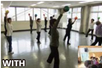
クラブ訪問 出張体験会

おかげさまで、日本けいらくビクス協会もだんだんと知名度をあげ、認定インストラクターも10名を超え益々発展の兆しでございます！ONスタジオにお越しの皆様にはいつも暖かいご声援を頂きまして誠にありがとうございます。日頃の感謝を込めまして2013年度は年会費半額でございます。11月には30周年パーティーもあります！